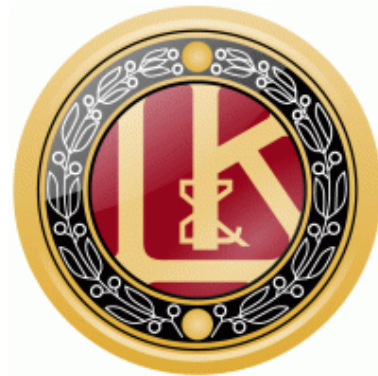
Původní logo firmy

málo na světě. Klement byl mimořádný obchodník a organizační talent, dnes bychom řekli, že byl výjimečný manažer. V roce 1905 zavedli v Boleslavi výrobu automobilů a firmu dál rozšiřovali. Když se nedostávalo kapitálu, Klement s Laurinem podnik bez váhání akcionovali (1907), v roce 1924 ji pak ze stejných důvodů přenechali plzeňské Škodě. Klement vynikal v mnoha směrech, také lidsky. S Václavem Laurinem zůstali až do smrti nejbližšími přáteli, ač jeho druh už neměl na chod firmy žádný vliv. Když Klement zemřel, veškeré své jmění odkázal na dobročinné účely, především na vzdělání stovek žáků a studentů. Zářný příklad skutečné osobnosti.