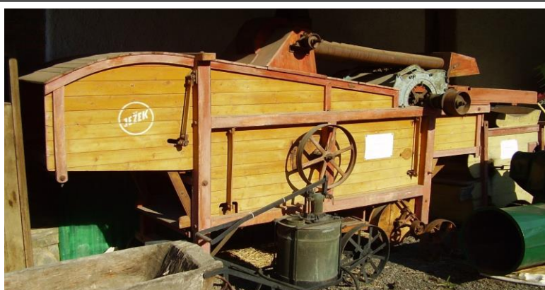
Fotografie úspěšné mlátičky firmy JEZEK, která na počátku minulého století vydatně pomáhala zemědělcům na vesnicích blanenského regionu, ale i na Malé Hané a Vysočině, úspěšně zvládnout jejich obilní žně.

Ježkové jako jedni z prvních vlastenecky smýšlejících obyvatel Blanska po revoluci roku 1848 zakládali a vedli české spolky, české instituce, stáli v čele obecní samosprávy, osvědčili své sociální cítění finančními podporami sociálním ústavům či zřizováním nadací pro studenty z Blanska. Svými organizačními schopnostmi prosadili nejednu významnou stavbu v Blansku a v neposlední řadě je třeba připomenout, že výrobky jejich podniku šířily nejen věhlas majitelů, ale zároveň proslavily sídlo podniku Blansko a dovednost blanenského dělnictva nejen v českých zemích, ale i v zahraničí.