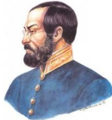
Jediná známá podobizna Jana Pernerera

Své odborné vzdělání získal studiem pražské polytechniky. V době, kdy svá studia končil, začínalo v Evropě období rozvoje železniční dopravy. Praktické zkušenosti se stavbou železnic získal v Německu, Anglii a v Rusku. Od roku 1837 se účastnil stavby Severní dráhy Ferdinandovy z Vídně do Krakova přes Břeclav a Přerov. Byl delegován do projekčních týmů pro trasování železnice. Pro svoji vysokou odbornost, talent a píli byl následně pověřen projekčními pracemi další železnice z Olomouce do Prahy a dále do Drážďan. Od roku 1842, kdy pod Pernerovým vedením byla tato trať vyprojektována a následně postavená, slouží až do dnešních dnů. Úsek z Pardubic do Prahy byl postaven pod jeho přímým vedením. Výkon tehdejší generace techniků, kdy během tří let (1843 – 1845) byla železnice vyprojektována, postavena a zahájen na ní provoz, obdivujeme do dnešní doby.